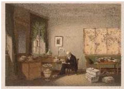
[00004773] Alexander von Humboldt in seinem Arbeitszimmer in der Oranienburger Straße 67 in Berlin Lithografie aus dem Jahr 1856 nach einem Aquarell von Eduard Hildebrandt

Bitte nennen Sie bei Veröffentlichung als Mindestangabe »Schmuckmuseum Pforzheim« und den Fotografen sowie gegebenenfalls Künstler und Leihgeber. Die aufgeführten Bilder stehen zur einmaligen Verwendung für den angefragten Zweck zur Verfügung. Bitte kontaktieren Sie das Schmuckmuseum Pforzheim im Fall einer gewünschten wiederholten Nutzung, vielen Dank.