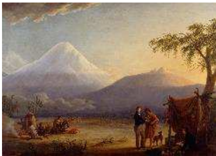
[50226106] Alexander von Humboldt und Aimé Bonpland am Fuß des Vulkans Chimborazo Friedrich Georg Weitsch, 1810 Öl auf Leinwand