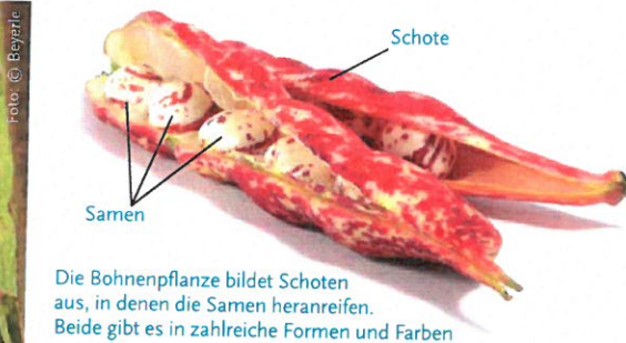
Die Bohnenpflanze bildet Schoten aus, in denen die Samen heranreifen. Beide gibt es in zahlreiche Formen und Farben