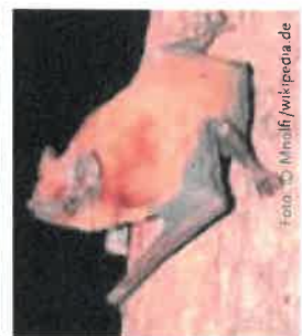
Bei uns häufige Arten (v.l.n.r.): Zwergfledermaus, Großes Mausohr, Großer Abendsegler

Fledermäuse orientieren sich beim Fliegen und der Nahrungssuche mithilfe ihres Gehörs. Während des Fluges stoßen sie ständig hohe Töne aus. Diese sind für uns nicht hörbar und liegen im so genannten Ultraschallbereich. Sie werden von Hindernissen, aber natürlich auch von den Beutetieren reflektiert und gelangen als Echoschallwellen zurück zum Ohr der Fledermaus. Daher haben Fledermäuse auch oft große Ohren. Auf diese Weise erhält die Fledermaus Informationen über Richtung und Entfernung von Hindernissen und Beutetieren.